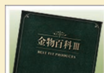
総合カタログ「金物百科Ⅲ」