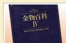
総合カタログ「金物百科Ⅳ」