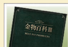
総合カタログ「金物百科Ⅲ」