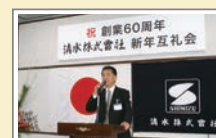
創業60周年記念新年互礼会