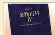
総合カタログ「金物百科Ⅳ」