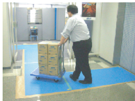
●養生テープの使用量が少なくて済みます。